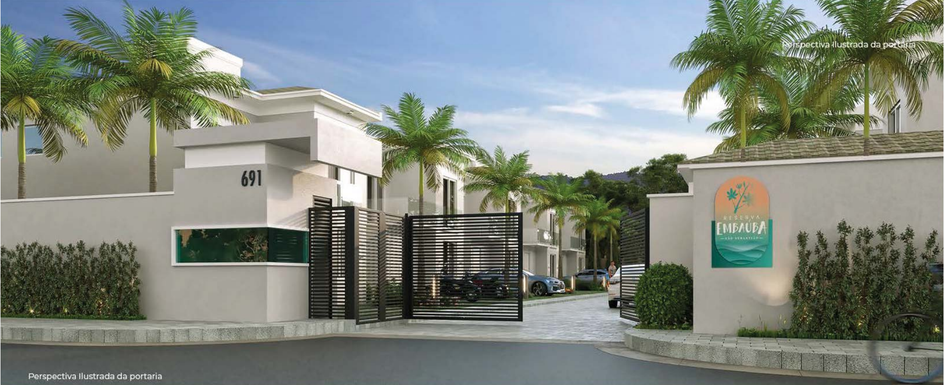
Perspectiva Ilustrada da portaria